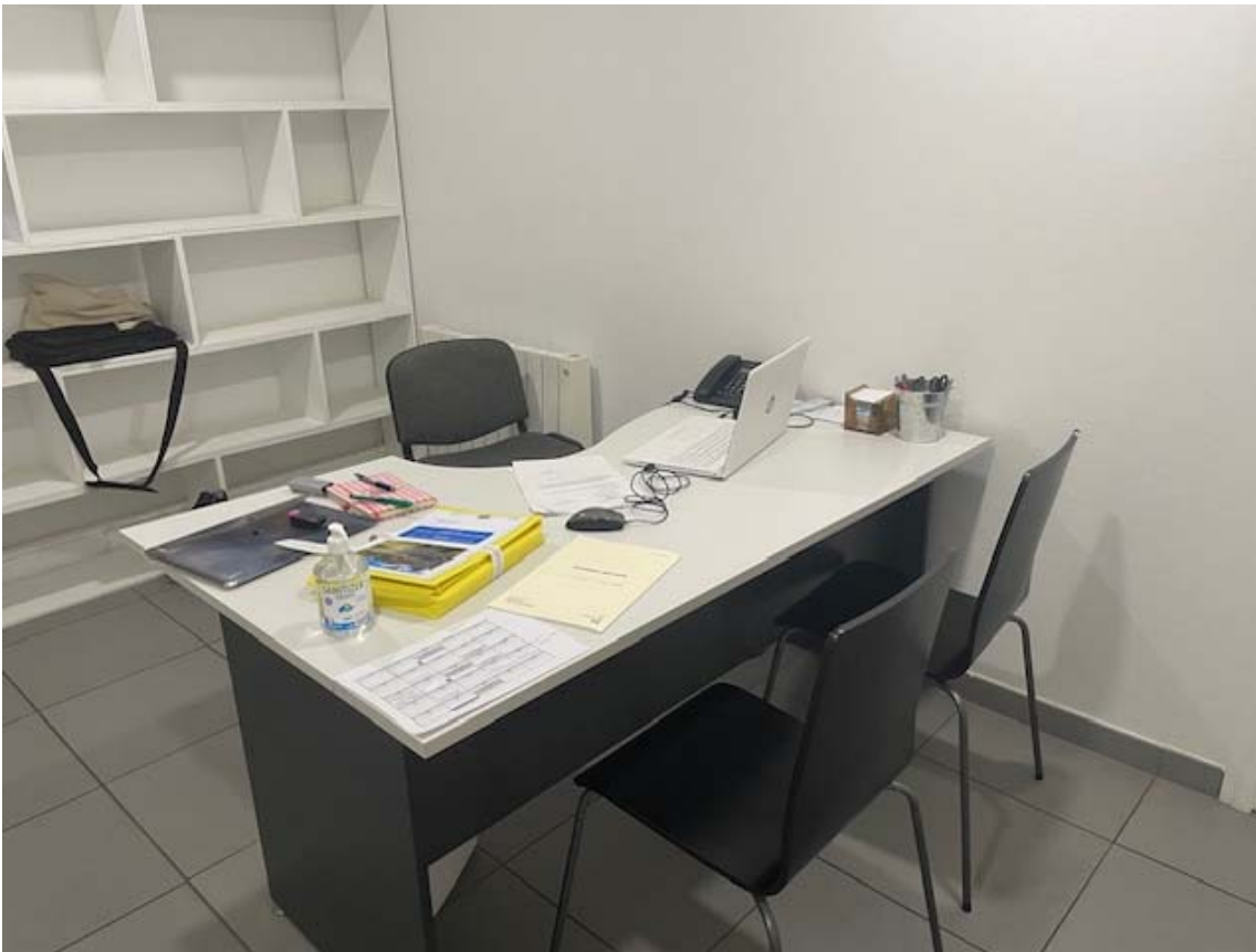
Permanence Mairie de VENDAYS-MONTALIVET